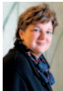
Isabelle Chassot, Präsidentin EDK.

Chassot: Nein, sie ist gesellschaftspolitisch unerwünscht, untergräbt die Integrationsfähigkeit der Volksschule und hat sich im Ausland nirgends bewährt. Ich setze mich ein für eine starke öffentliche Schule.