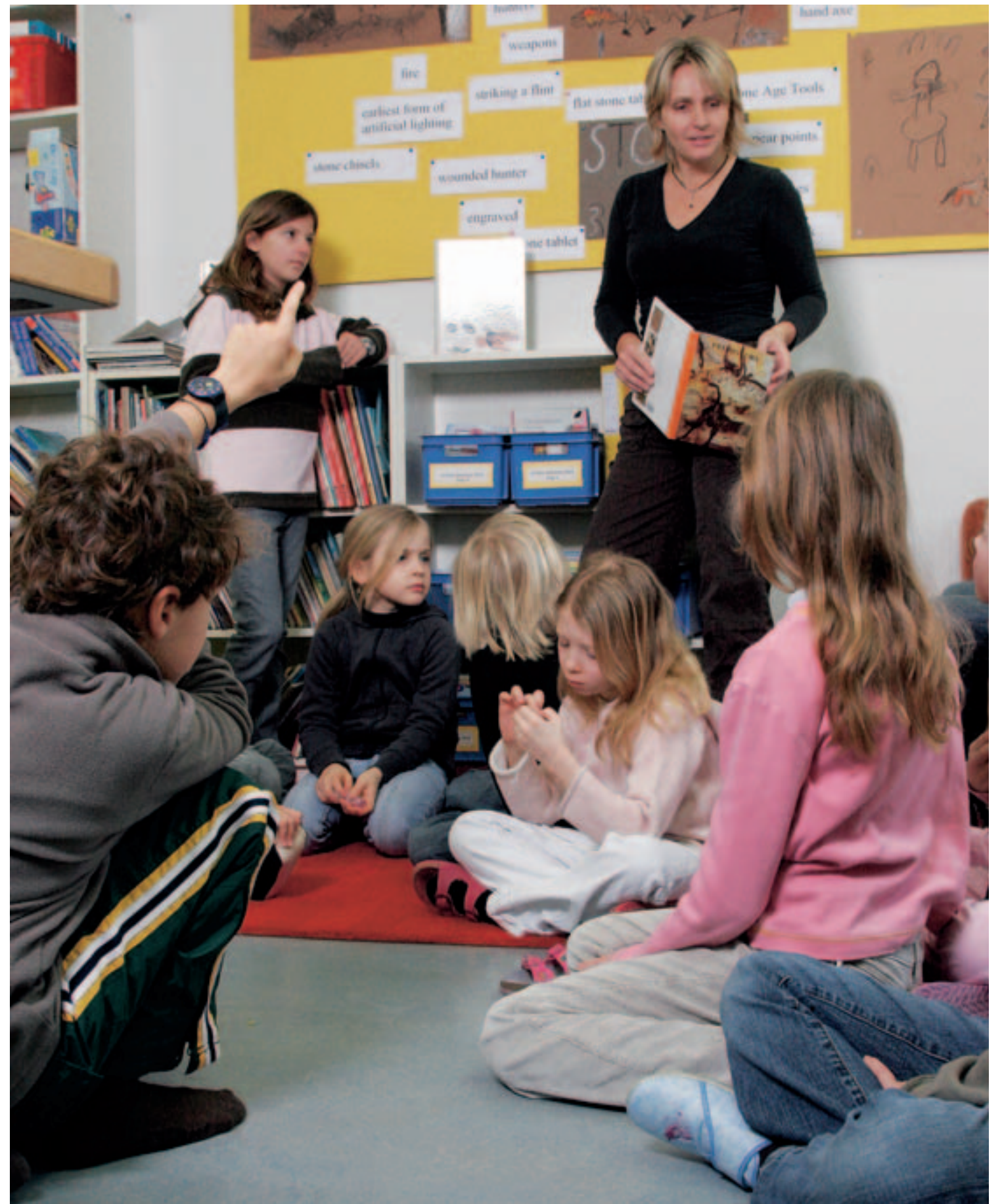
Lakeside School, Küsnacht ZH: Schon in der Primarschule werden 50 Prozent des Unterrichts auf Englisch erbracht.